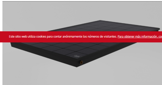
El panel aH72SK.

EMPRESAS MADE IN SPAIN MÓDULOS Y PRODUCCIÓN (UPSTREAM) TECNOLOGÍA E+D ESPAÑA