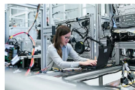
El Pla de Doctorats Industrials celebra 10 anys amb més de 800 projectes desenvolupats