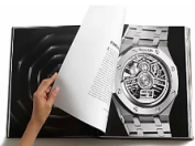
Royal Oak: el arte de plasmar la vanguardia en la literatura