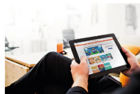
Activa tus neuronas con los mejores juegos gratuitos de elEconomista