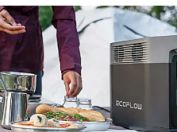
Ya es posible ahorrar en la factura de la luz con el nuevo dispositivo DELTA 2