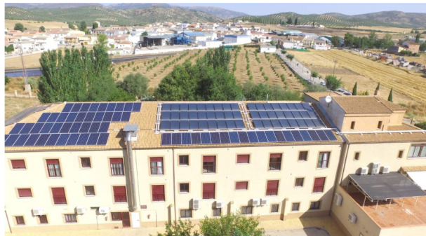
Instalación de paneles solares híbridos de Abora Solar.