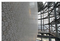
Las nuevas oportunidades empresariales de la economía circular