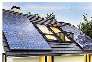
Casa Solar ¡Los paneles solares son ahora una ganga, gracias al gobierno!