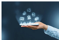
Compara productos financieros y mejora tu economía personal