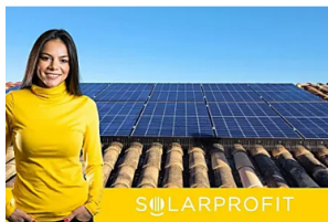
Solar Profit Placas solares: ¿vale la pena?