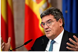
Así cambiará la jubilación tras la reforma de las pensiones aprobada por el Gobierno Onda Cero - Noticias