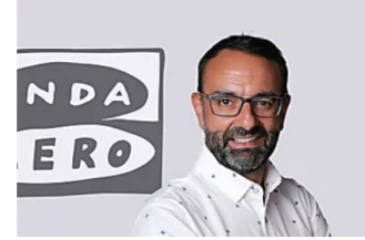
Radioestadio hora a hora (20:00-21:00) 28/08/2021 Onda Cero

ULTIMA HORA > Toda la información y noticias del conflicto en Afganistán y el control talibán en Kabul >>