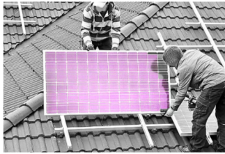
Propietarios: Lean esto antes de obtener paneles solares The Eco Experts