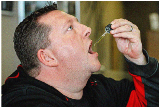
Médicos Desconcertados: El Nuevo Aceite de CBD que Arrasa en España Health Today