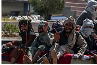
Los talibán advierten a occidente de que "si continúan con la ocupación" más allá del 31 de agosto "habrá consecuencias" Onda Cero - Noticias